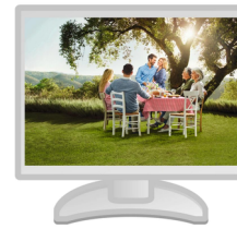
Seite 1 Die Versorgung im öffentlichen Dienst